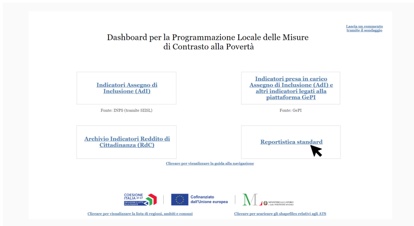
Figura 1 - Accesso alla Sezione Reportistica Standard

Dopo aver effettuato l'accesso alla dashboard, per scaricare la tabella di analisi PAL precompilata, naviga alla sezione “Reportistica Standard” come mostrato sotto (Figura 1).