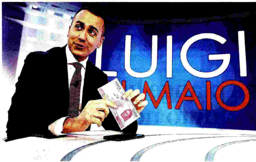
Luigi Di Maio «Il Reddito di Cittadinanza è una misura imponente che ci mette perlomeno in pari con l'Europa»